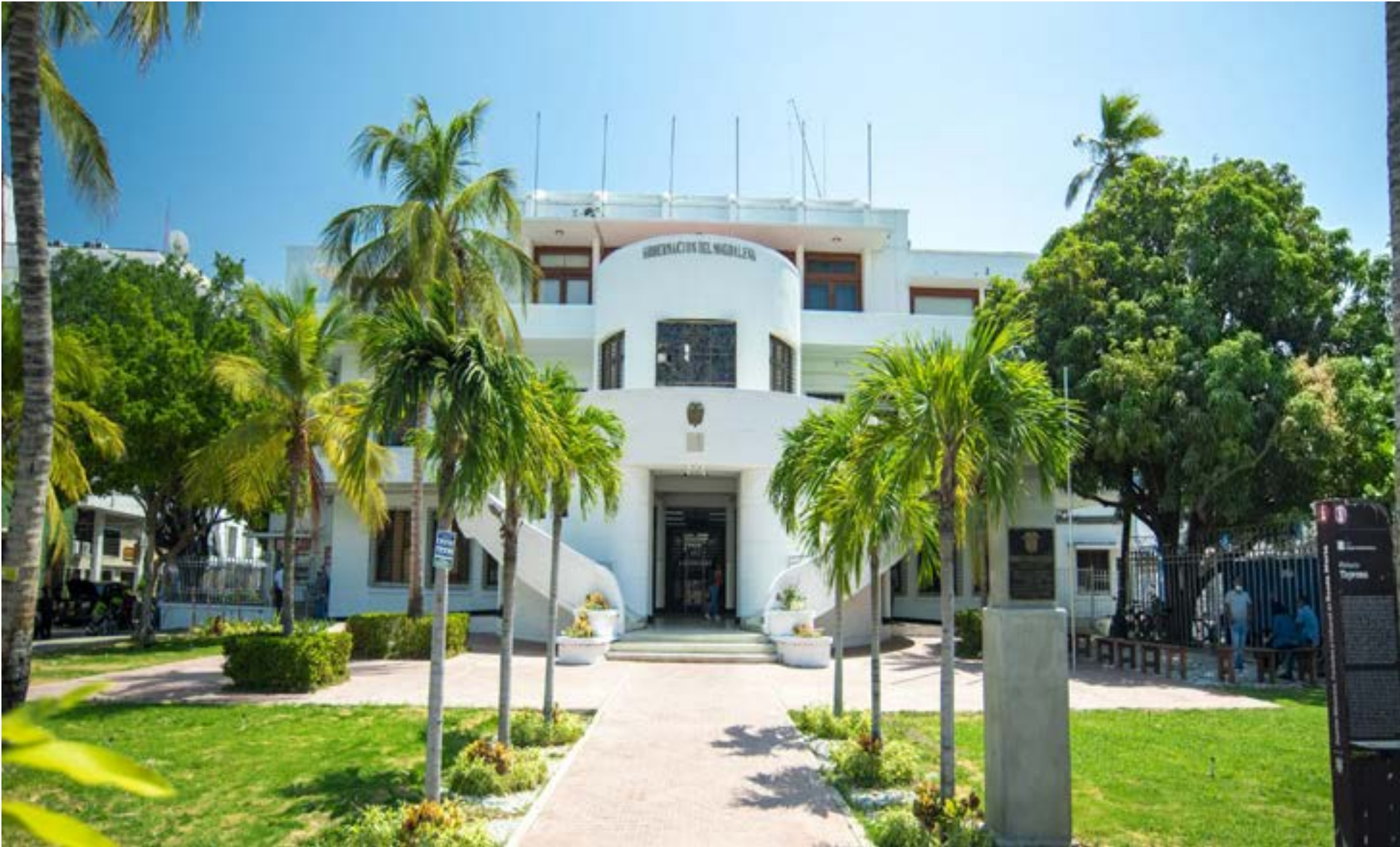
El Ministerio del Interior convocó las elecciones atípicas del Magdalena para el 23 de noviembre de este año. Los candidatos tendrán 15 días calendario, a partir de la publicación del decreto, para inscribirse para estas elecciones.

la definición de sus candidaturas unificadas.