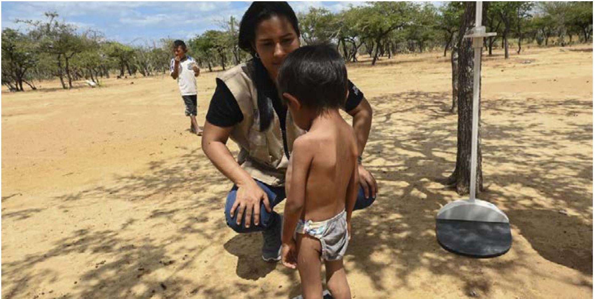
Una fuerte caída en las muertes de niñas y niños menores de cinco años por desnutrición aguda en el país.