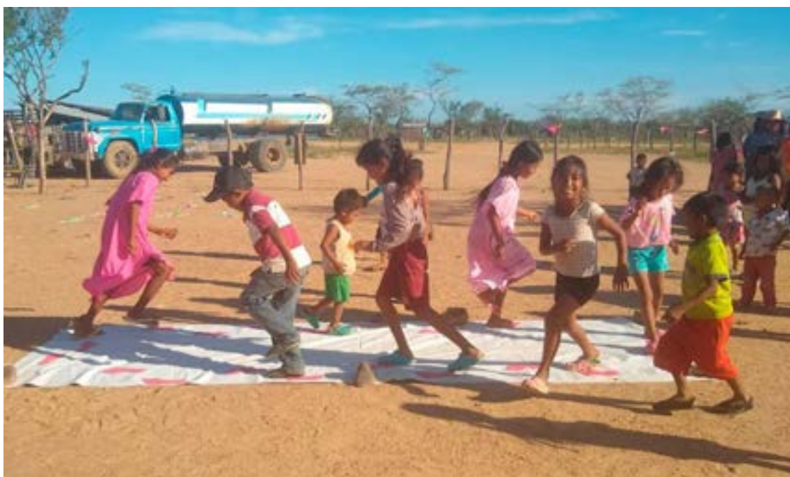
Los niños de La Guajira en la actualidad reciben alimentación y atención del Gobierno que se refleja en la alegría expresada en sus juegos.

El mandatario presentó las siguientes estadísticas, que corresponden a la semana 33 (entre la segunda y tercera semana de agosto) de cada año: