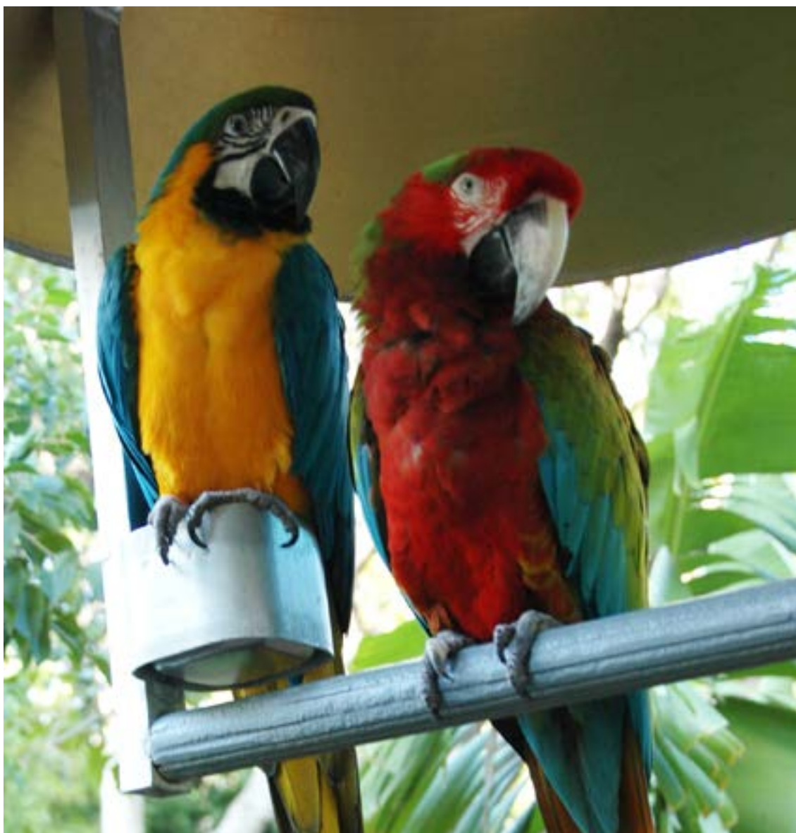
Colombia ha sido elevada a la cumbre de la conservación global tras recibir la prestigiosa medalla NBSAP Reverse the Red 2025.

Colombia brilló por un proceso de construcción «sin precedentes», que incluyó la voz de más de 100.000 personas en 23 ciudades. Esta masiva convocatoria involucró a comunidades étnicas, la academia, el sector privado, organizaciones sociales y 15 entidades del