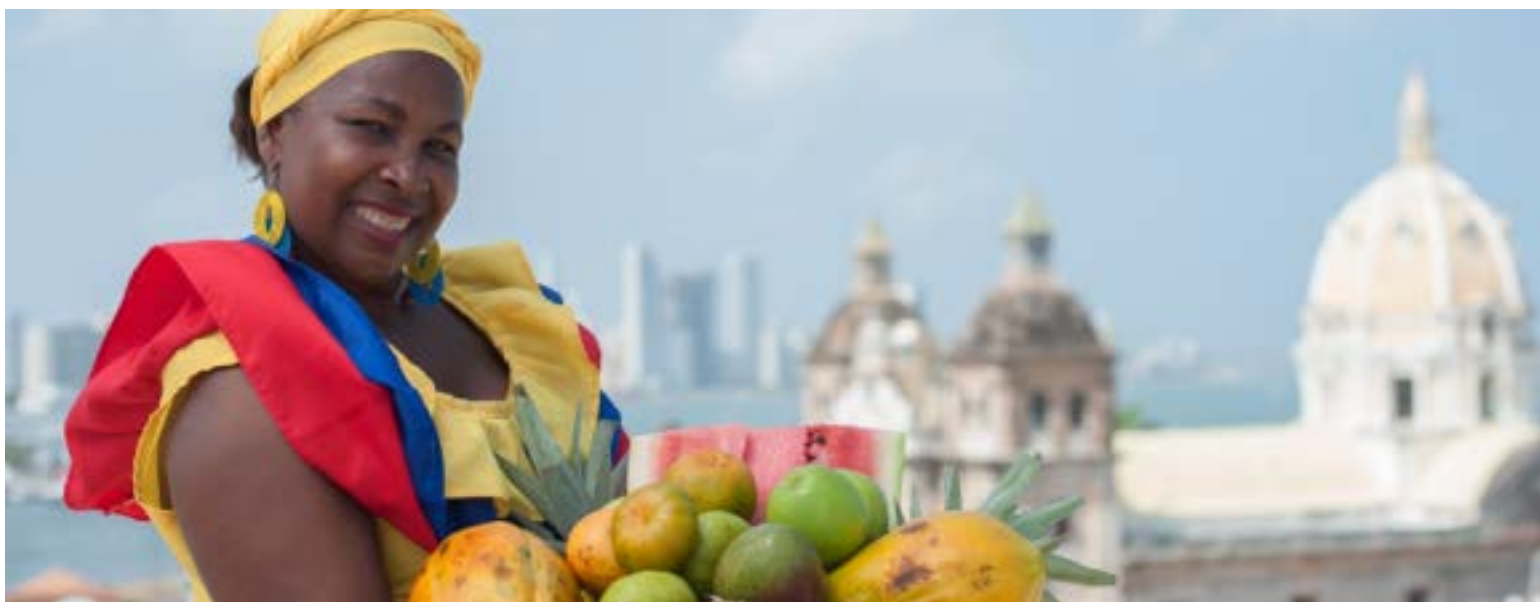
Vendedora de frutas en Cartagena.

La cadena 100% colombiana, Movich Hotels, desde sus inicios hace más de nueve años ha destacado la participación de las mujeres en diferentes posiciones, hoy por hoy el 50% de sus hoteles son liderados por mujeres profesionales y muy destacadas en el sector turismo.