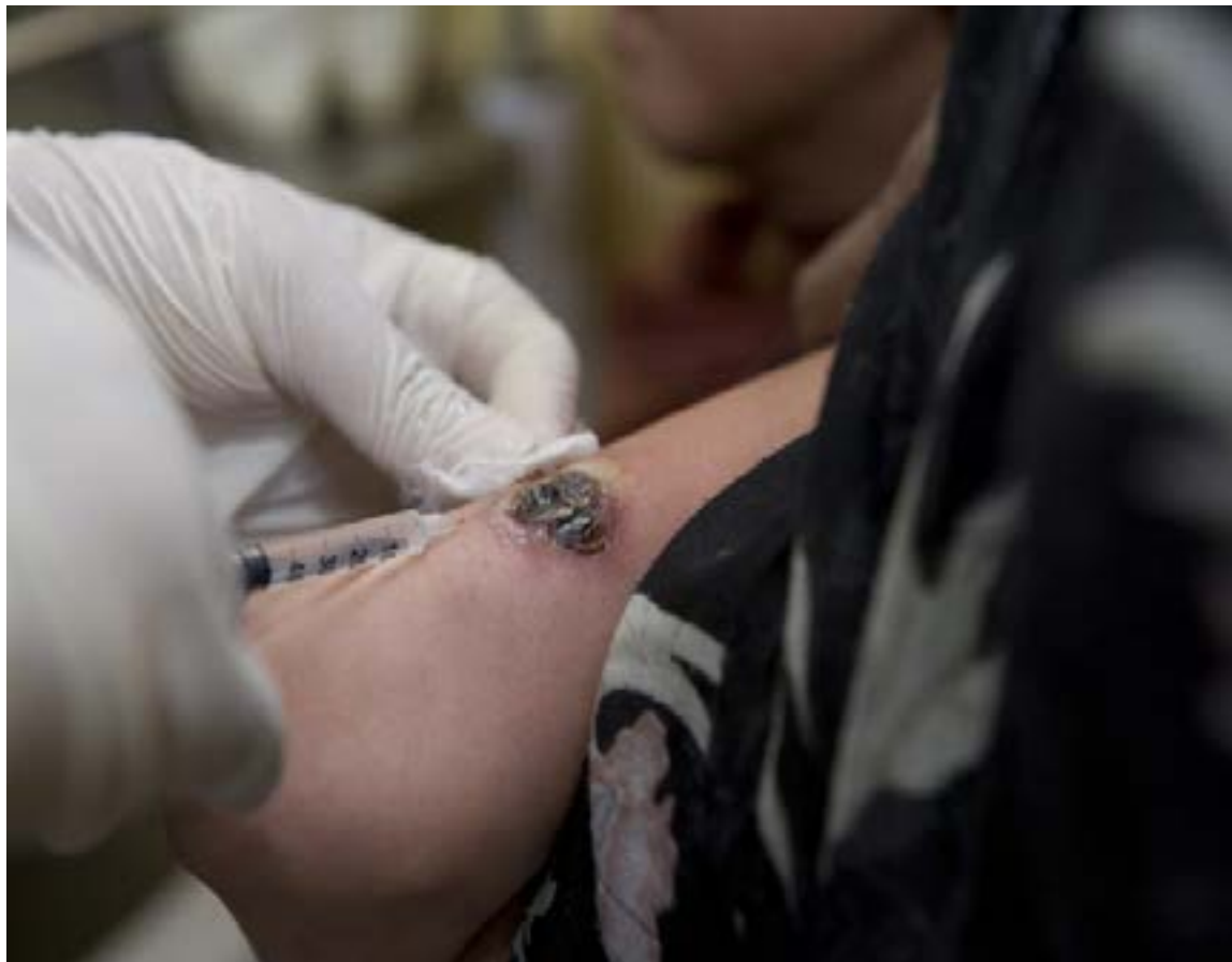
Persona infectada con leishmaniasis