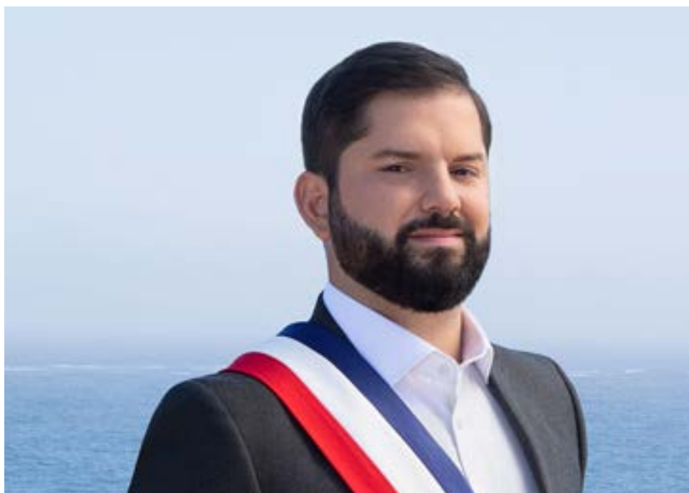
Gabriel Boric, presidente de Chile