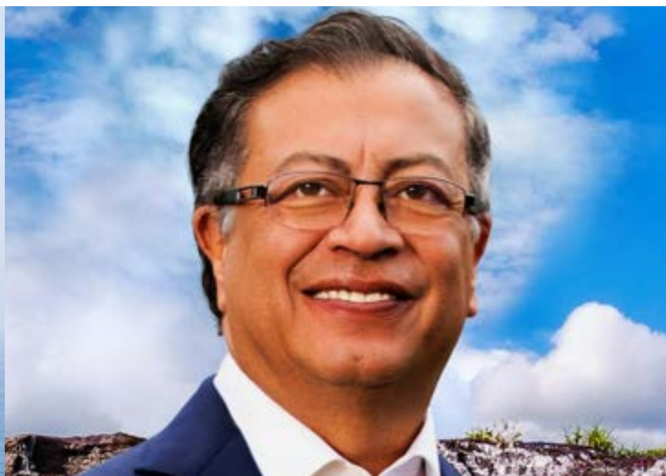
Gustavo Petro Urrego, presidente de Colombia

E l martes pasado hablaron ante la Asamblea General de la ONU varios presidentes y con muy distintos discursos. Petro y Boric coincidieron en el enfoque de los problemas que más atraen hoy día a quien gobierne un país. Ambos son de izquierda.